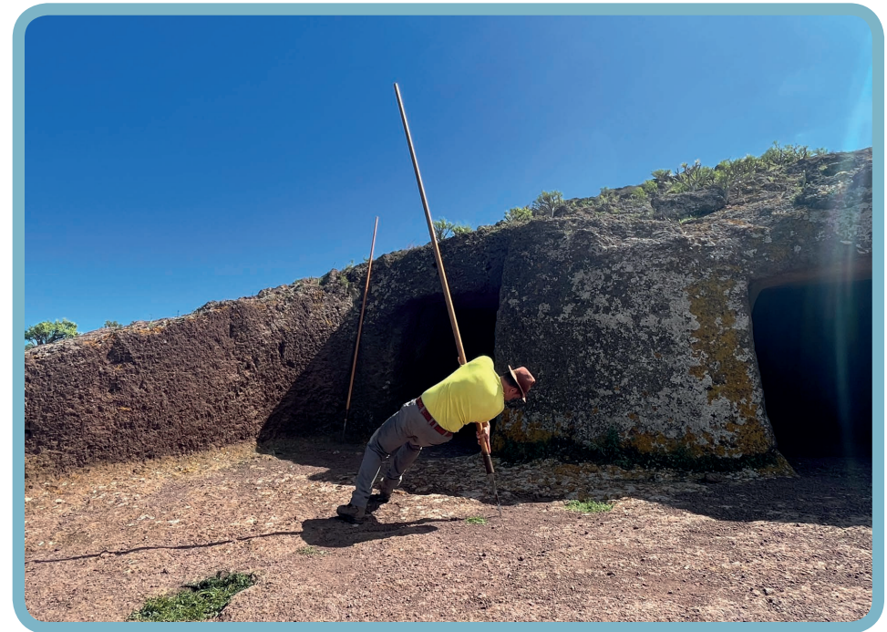
La vuelta del pastor.