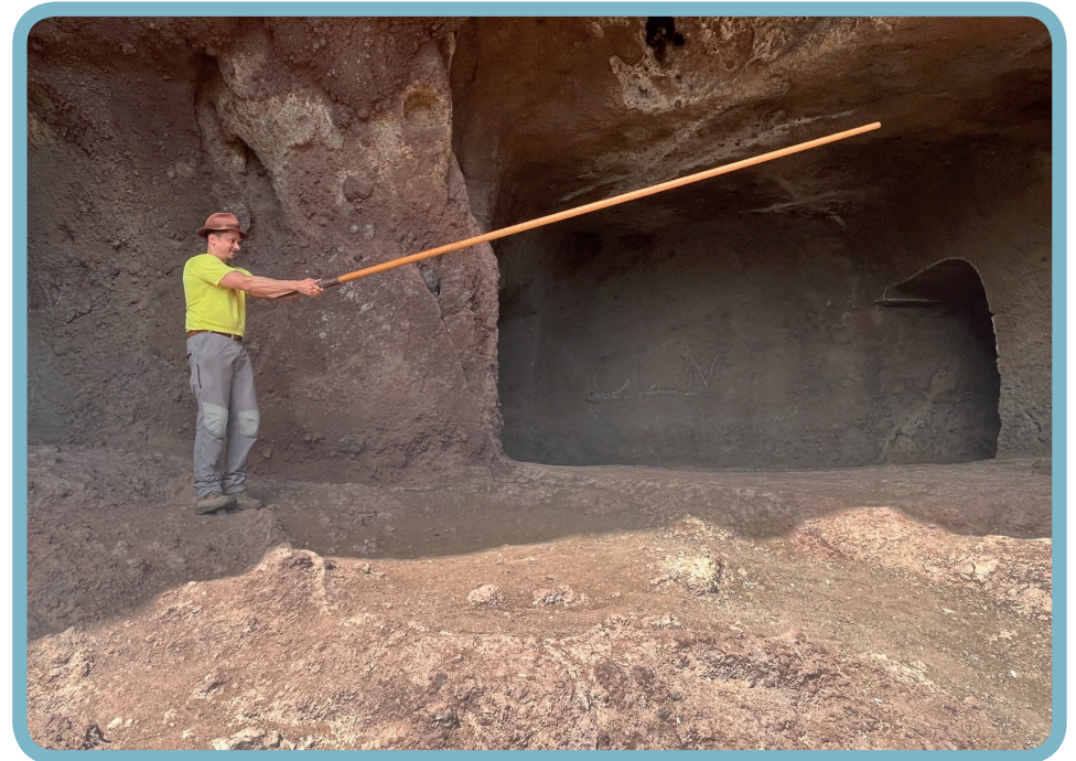
Salto del pastor canario en las medianías de Gran Canaria. Fotografías de José Raúl Lorenzo Armas.