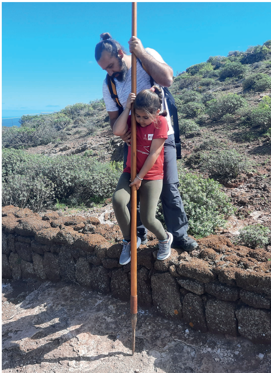
Salto del pastor canario en las medianías de Gran Canaria.