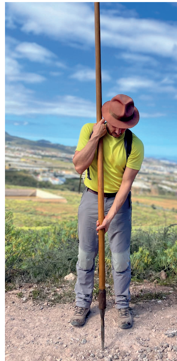
Colocación de las manos en el implemento de salto del pastor.

Tradicionalmente, a modo de prueba de fuerza y agilidad, había momentos en los que se realizaban juegos con el palo. Por lo común eran llevados a cabo por pastores como actividad de ocio.