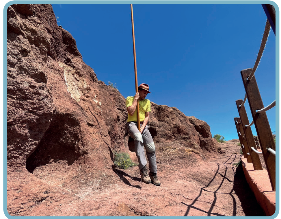
Salto a pies juntos. Fotografías de José Raúl Lorenzo Armas.