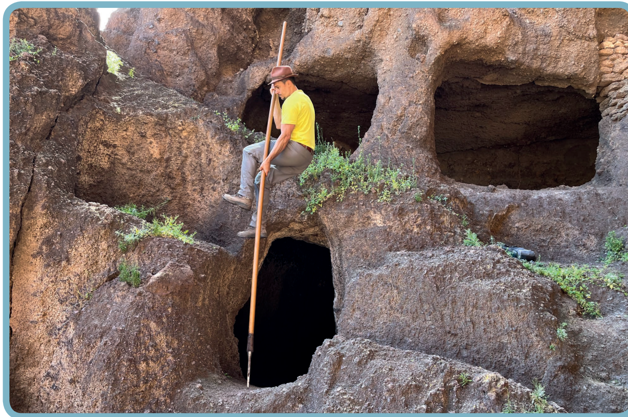
Salto de «piedra a piedra».