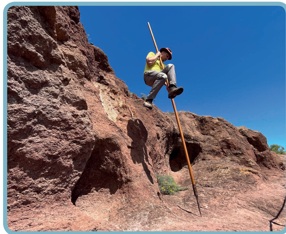
Salto a la banda.