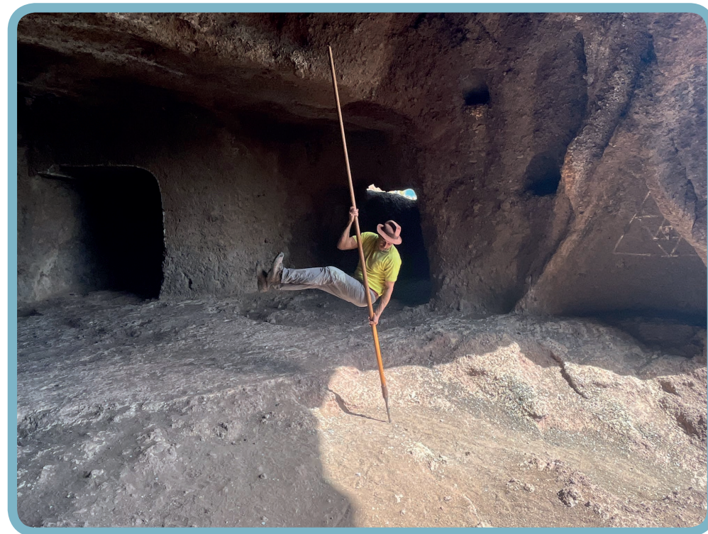
Hacer la bandera.

Hacer la bandera, en el que teniendo la lanza clavada se coge impulso y debemos mantenernos perpendiculares a esta, dejando nuestro cuerpo de forma horizontal el mayor tiempo posible.