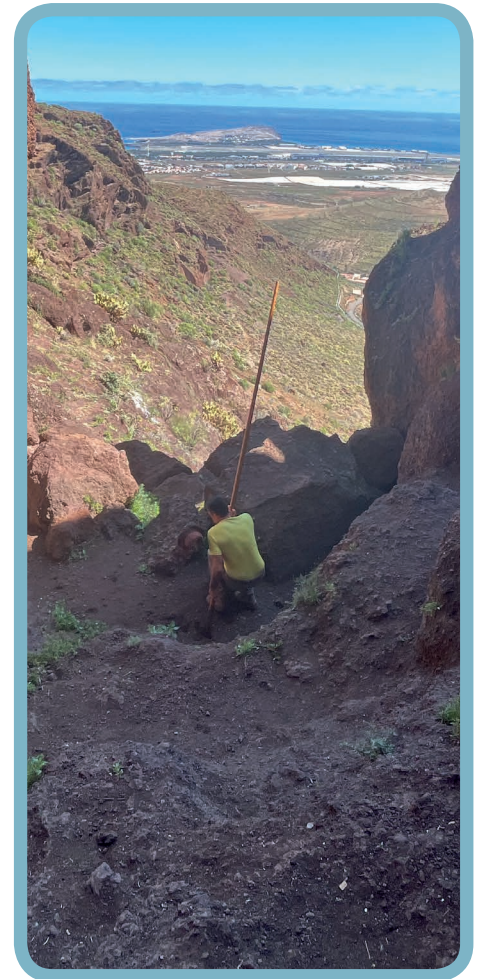
Salto a regatón muerto.