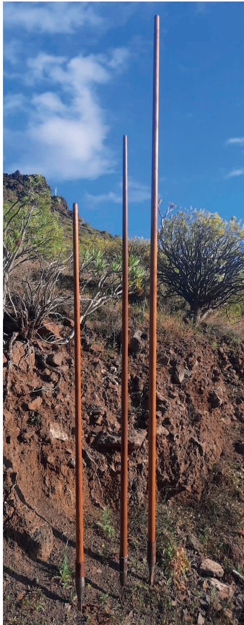
Salto del pastor canario en las medianías de Gran Canaria.