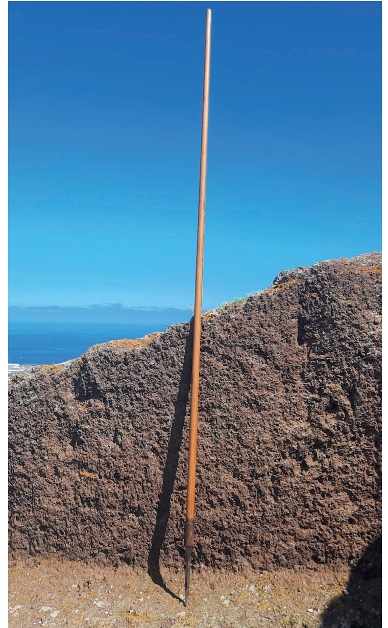
Salto del pastor en las medianías de Gran Canaria.

¿Para qué creen que es la pieza metálica de la parte inferior, y qué función tiene?