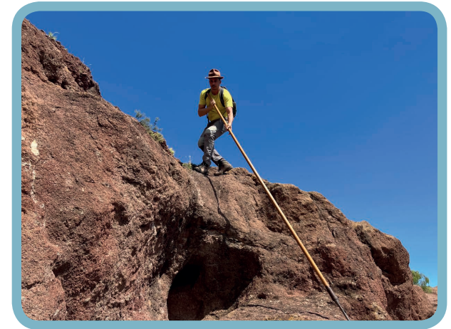
Uso del implemento para ascender

Si queremos subir por una pared de piedra, roca o risco, podemos hacerlo de dos maneras: