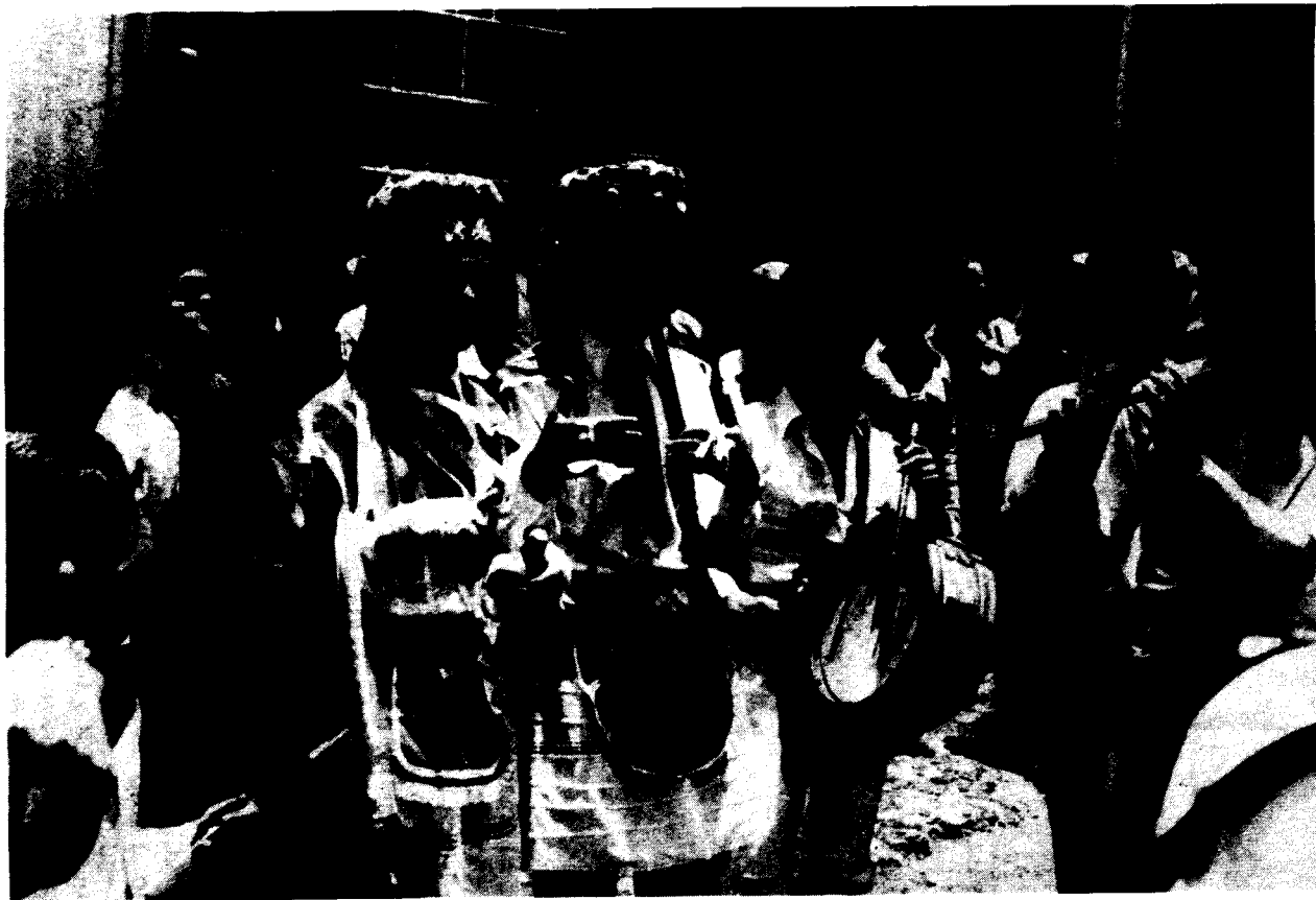
«En La Tomillera» (El Pinar).