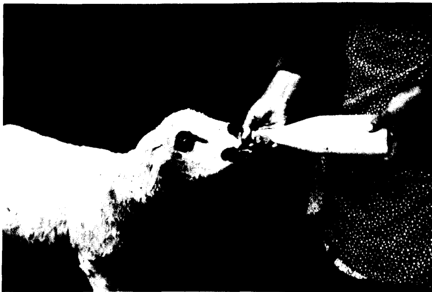
«Dando el tetero».

al gallinero y le puse la bolilla en los higos pasados. Le dije: ¡Ay, si yo lo hubiese sabido más luego (antes)! ¡Me marchó, coño!. Mi hijo el más chico subió conmigo ese día conmigo a la Dehesa y fue llorando hasta el Letime; allí, sin poderlo callar, le dije: vete tú por debajo que yo voy por encima. Yo les cuento a Ustedes esas cosas y alomejor dirán que es imposible, pero fue así. Como ése no tuve ningún perro. (Estuvo buscando un buen rato el ajorás y, a continuación, dijo) Es capaz que me perdieron el ajorás icoño!. Yo creo que yo lo he visto del año pasado pacá, coño. Me quedó pena por no haberles enseñado el ajorás ese» 9 .