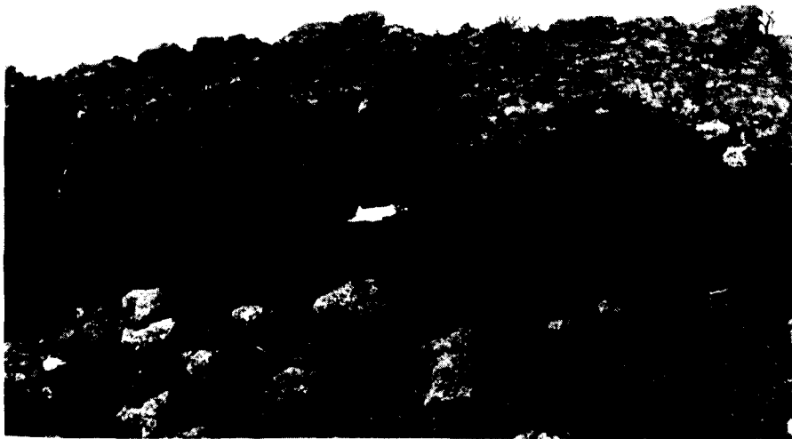
Juaco del Caracol (La Dehesa).

Las «loas profanas», que suelen ser más cortas que las anteriores, se declamaban a viva voz con motivo de determinadas celebraciones festivas: carnavales, la víspera de la Cruz (El Pinar), vísperas de San Pedro y San Juan. Se solicitaba atención y se decía la loa, contestando desde la otra parte del pueblo, denominándose a ambos bandos de diferente forma (judíos/moros; españoles/alemanes...). Estos enfrentamientos, en los que en más de una ocasión llegaron «a sacarse los trapitos» y en los que incluso se hacían prisioneros venciendo la parte que más colorido, disparos (ruido) y novedades presentase, concluían con el encuentro colectivo –tras haberse depurado el ambiente– donde la comida común y el reconciliador baile del Tango eran los ingredientes que formalizaban la conciliación. Entre las numerosas loas recogidas, no faltan las que entreven la ya mencionada influencia pastoril: