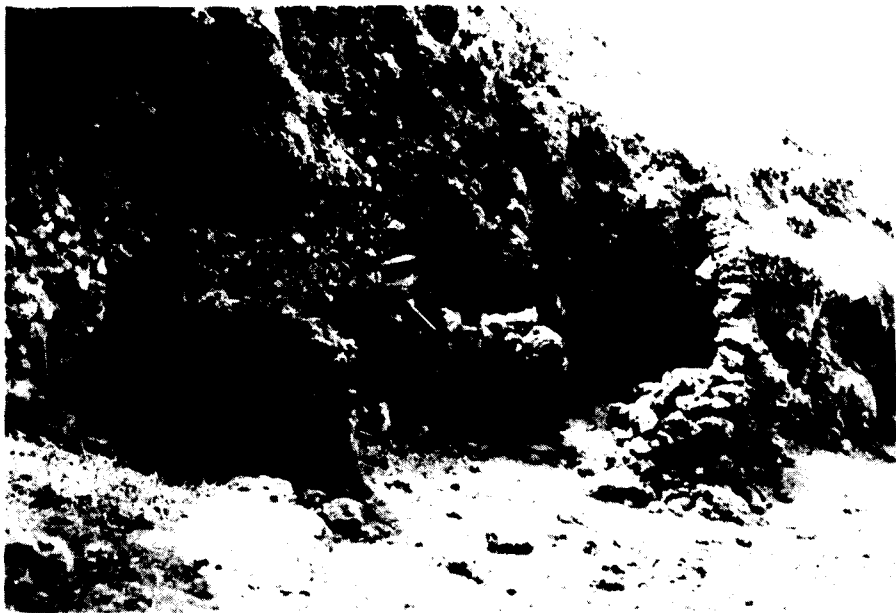
Antiguas viviendas pastoriles (Montaña del Caracol. La Dehesa).