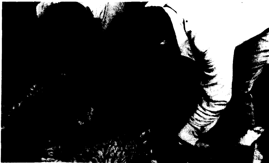
Detalle de la pela.

Aunque en la actualidad, y en ocasiones, se cuente con productos de la farmacia, conviene tener presente las fuertes deficiencias sanitarias, veterinarias..., que ha arrastrado la Isla. Por dicho motivo, el pastor suele seguir empleando antiguos remedios –algunos de ellos se remontan a la época aborígen– para curar las enfermedades de sus reses: «tetera, papeas, quebranto o mal de ojo, sereno negro, sereno blanco, ceguera, currencia, de los cascos, frío en el ubre»... De cada una de ellas hemos analizado sus causas, síntomas, remedios empleados y lo que acaece tras la aplicación. El siguiente cuadro corresponde al denominado sereno blanco, el menos dañino.