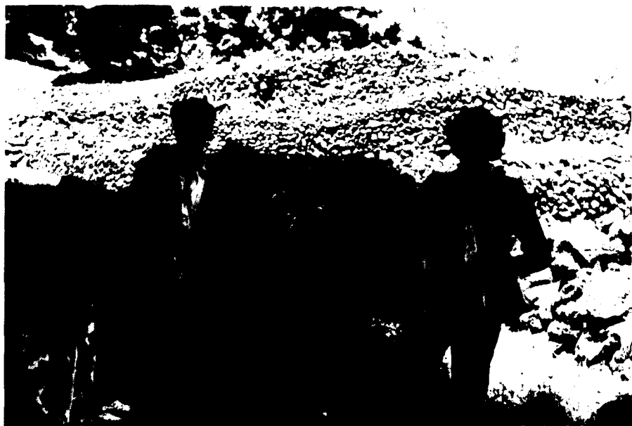
El perro del pastor.

«Mamaban dos meses o dos meses y medio, eso dependía del invierno. Si llovía en octubre, pa la Paz, los quitábamos cuando ellos hallaban de comer. Si llovía en diciembre, pal 17 de San Antón, o si no cuando víamos que no se morirían de hambre (...). Al suponer estaba ya destetado y nació un cordero que a Usted le gustaba, lo quitaba y lo criaba con sueros después de mamar ocho días de la madre» 7 .