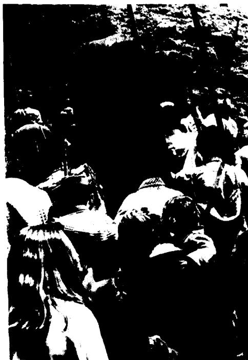
Fiesta de los pastores.

Los naturales de la Isla continúan diferenciando, a nivel social, entre los «rabos blancos» o «caballeros de la Villa», a los que se ha dado el tratamiento de «Su Merced» y de Don, y los «rabos negros», grupo que engloba a los habitantes del «Campo» y a los de la Villa de Valverde que no pertenecen al grupo privilegiado antes señalado.