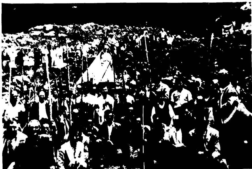
Los pastores se despiden de la Virgen. Fiesta de Los Pastores, Abril de 1962.