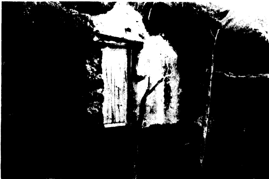
«La Cueva de Tomás» (La Dehesa).

«Mi marido es un carnero pero yo lo vuelvo chivo. Hijo, esta carta te escribo; trabaja y rómpete el cuero» 24 .