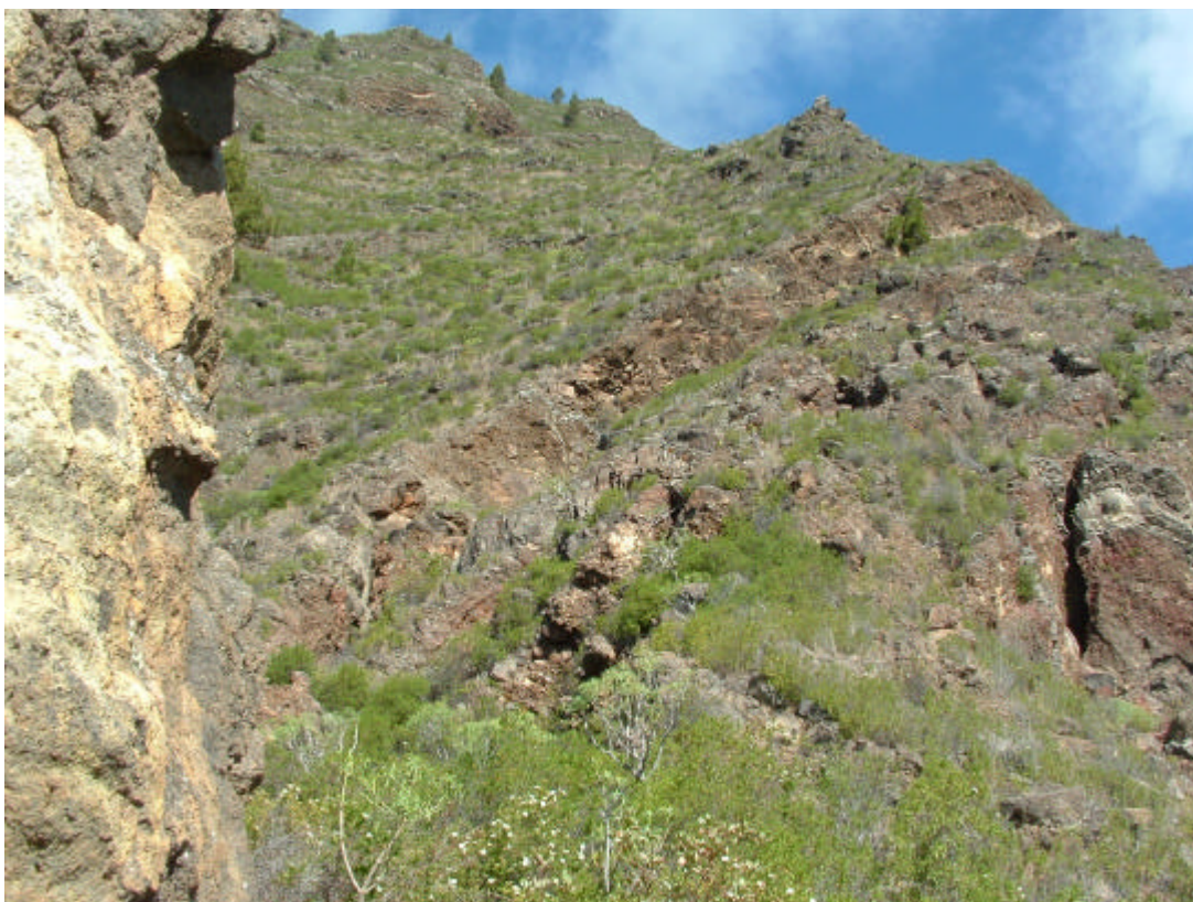
Panorámica lejana donde se aprecia mejor la línea de fractura y el hundimiento del lado derecho de la montaña.