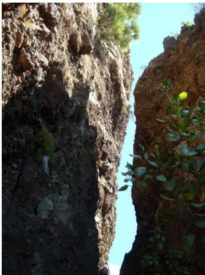
Detalle de la grieta con su poco anchura y gran profundidad en la línea de fractura.