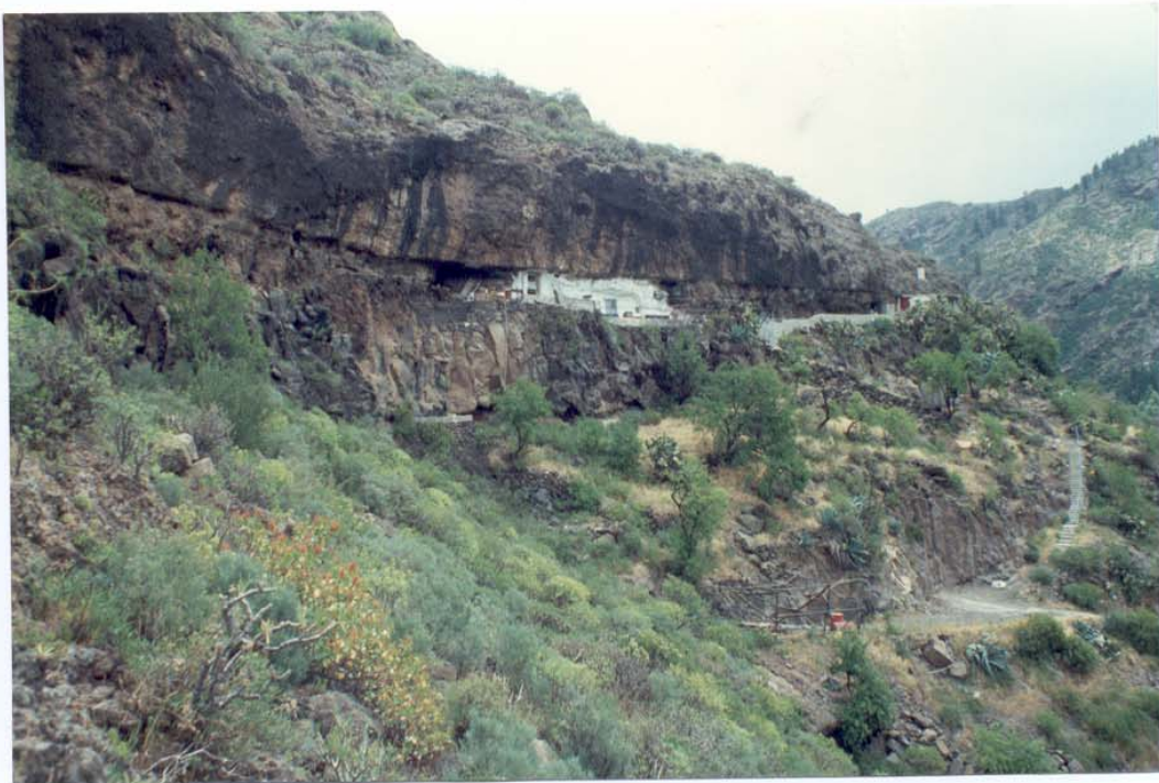
CUEVA MOGAREN, EL JUNCAL DE TEJEDA