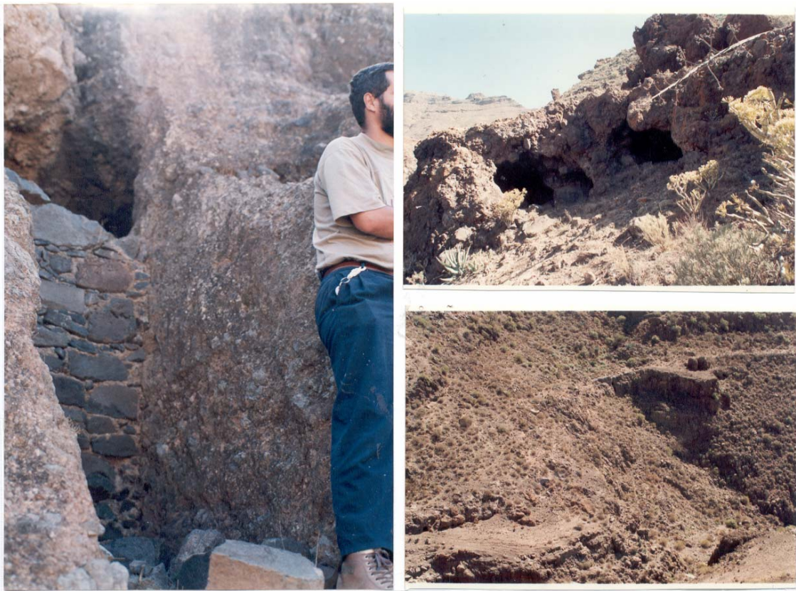
Diferentes vistas de La Ladera MUGARÉN, Fuente MUGARÉN, Cuevas MUGARÉN. TAIDÍA. S.B. TIRAJANA.