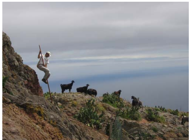
Fiesta del Regatón 2007, ruta a Fuente Chigudín.