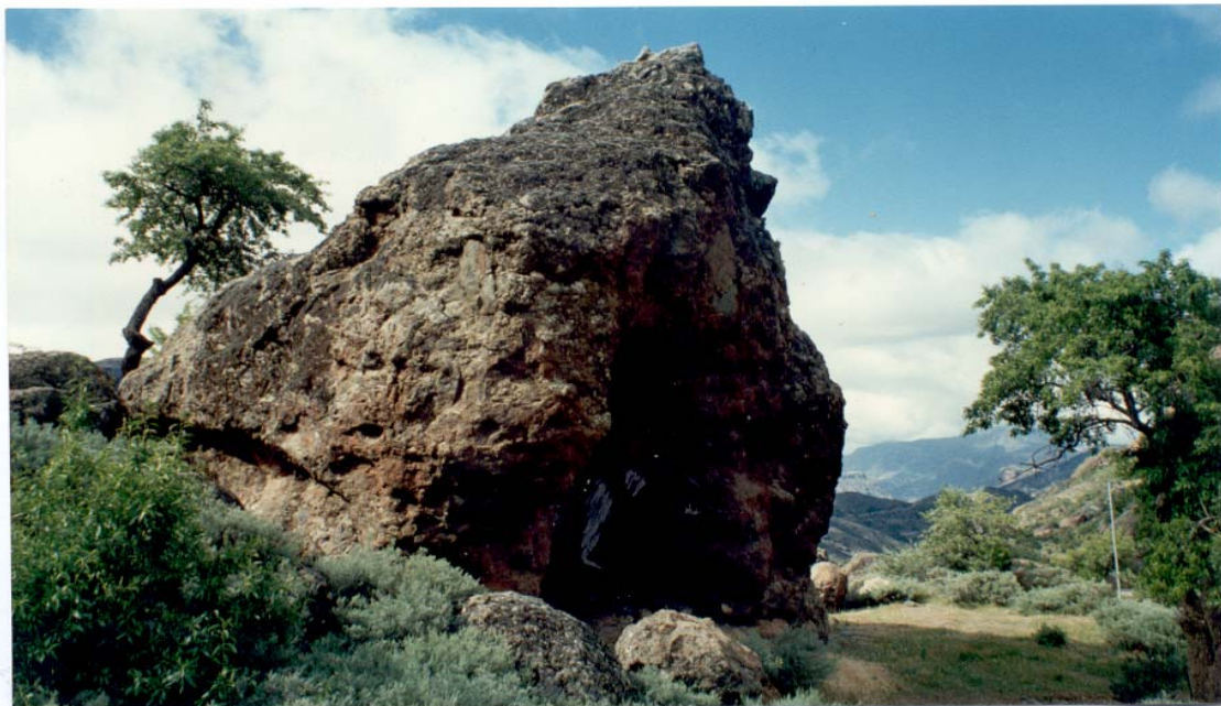
Piedra MOGARÉN . AYACATA, TEJEDA..

Está situada en las cercanías del pueblo en una zona donde existen multitud de rocas de notables dimensiones. La <<Piedra MOGARÉN>> tiene un cierto aspecto piramidal y, en su base, hay una oquedad natural que proporciona una buena sombra. Servía de sitio de parada, refugio o descanso de los antiguos viajeros ya que, a su lado, pasaba el <<camino real>> que unía ARGUINEGUÍN con la otra banda de la isla. En tan estratégico lugar existían también nacientes de agua.