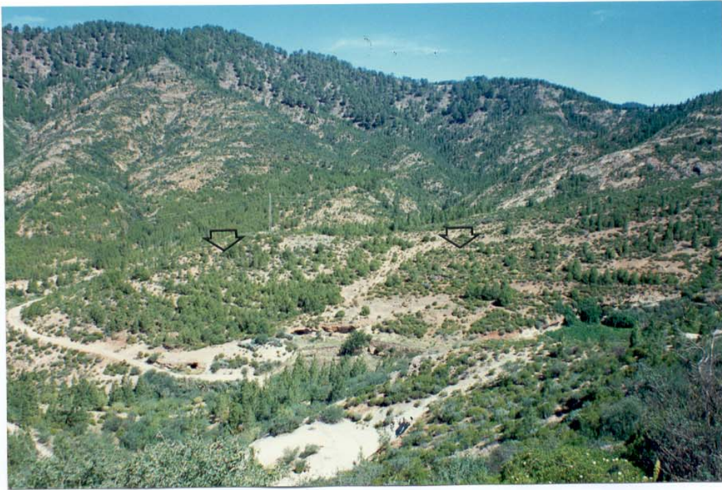
LOMO MOGARENES, ACUSA (ARTENARA)