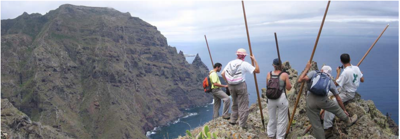
Al fondo, llano y cuesta: Tesege.