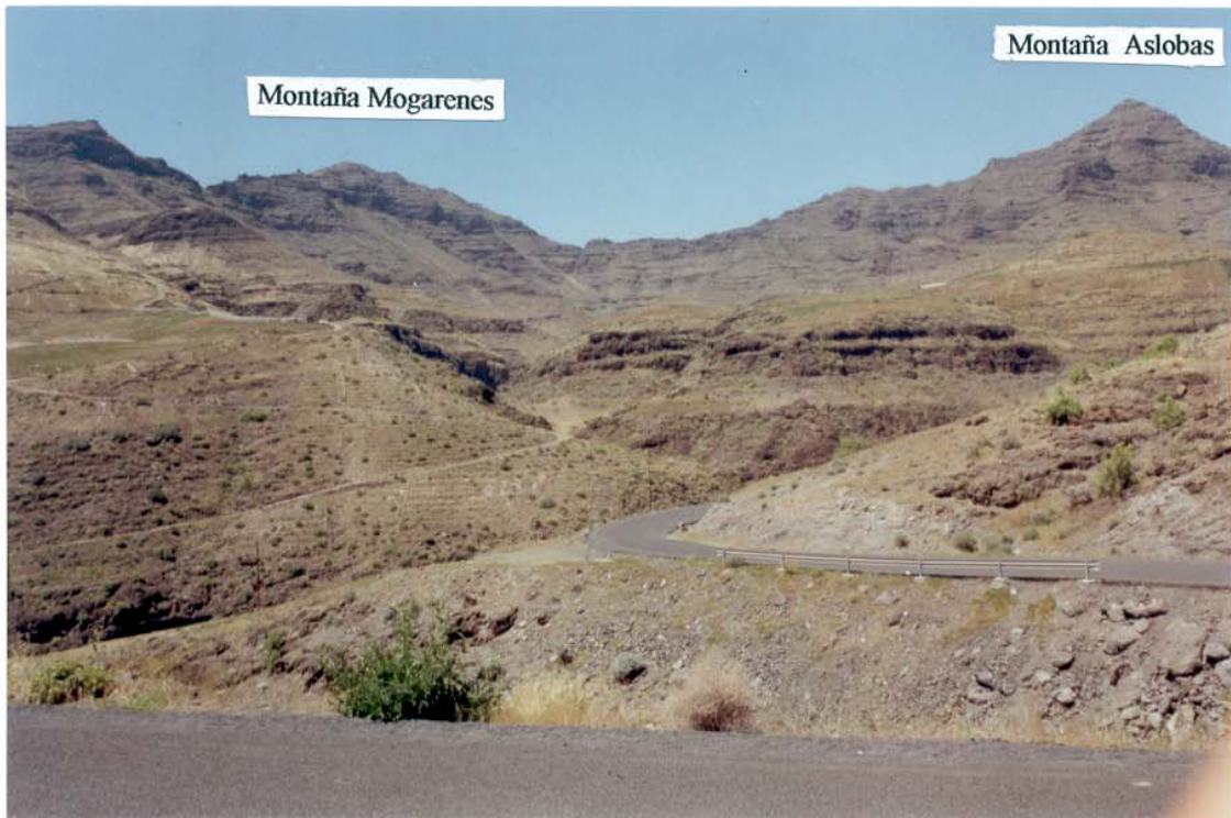
Vista de La Montaña Mogarenes desde el Barranco de Tasarte.