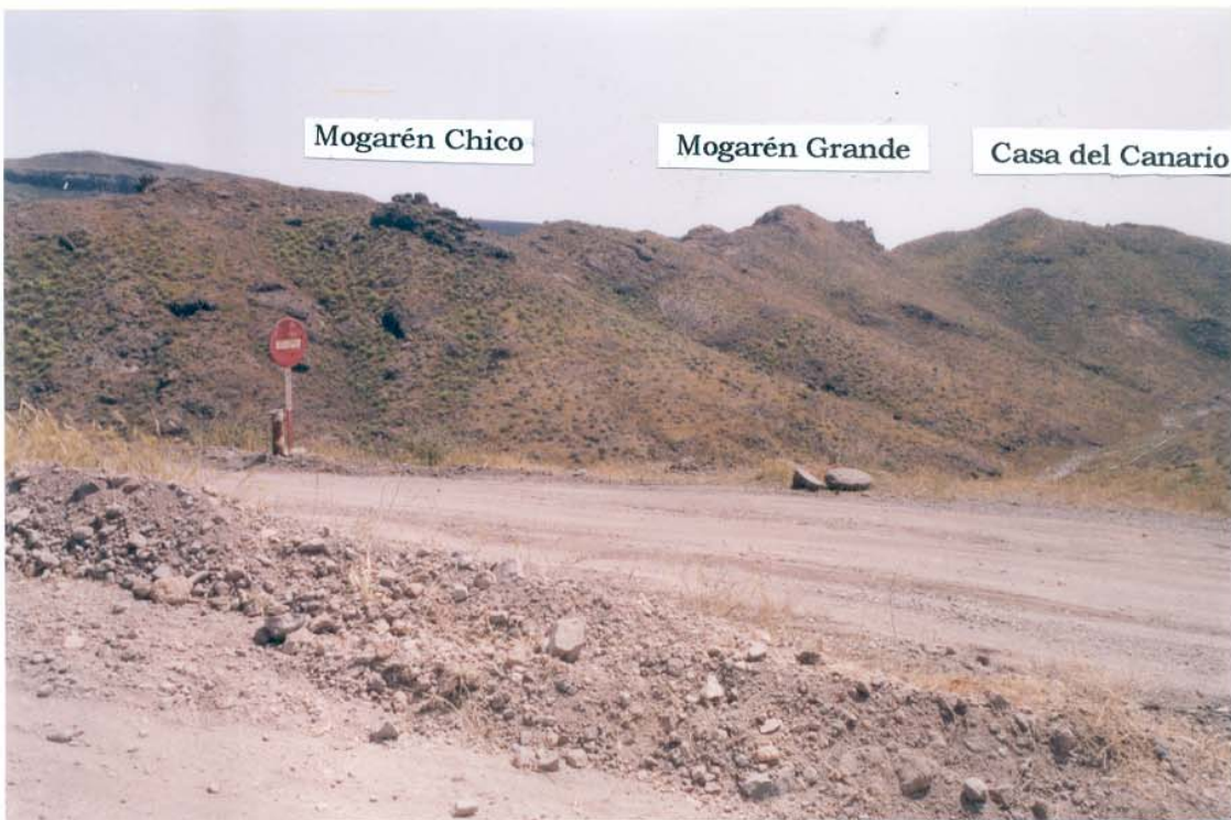
Mogarén Chico, Mogarén Grande. S.B. Tirajana.